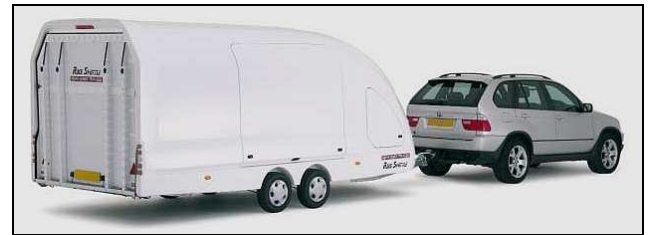
Carrosserie moulée polyester / Châssis galvanisé