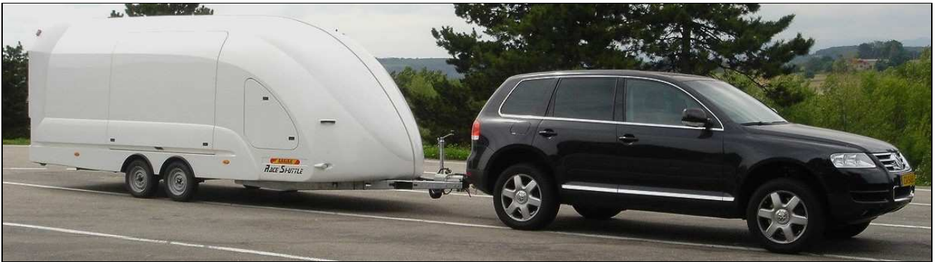
Transport incognito à l'abri des intempéries / Freinage à inertie agissant sur les quatre roues de la remorque