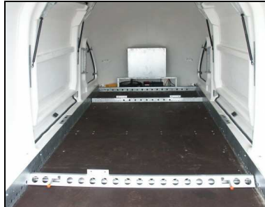
Cales de roue (2 ème en option)