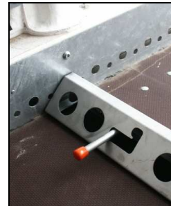
Verrouillage des cales de roue