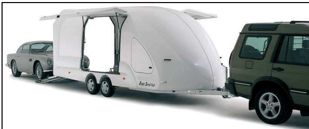
Toutes les portes sont munies de vérin à gaz et fermetures à clés