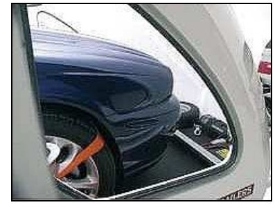
Visibilité totale durant la phase de chargement d'un véhicule / Portes papillons latérales facilitant la montée et descente du véhicule Portes latérales avant facilitant la mise en place des sangles de maintien