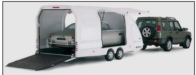
Faible angle de chargement (10°)